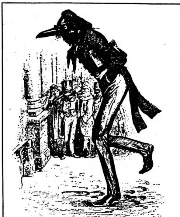
Die Studien in der Psychopharmakoforschung sind beschwerlich und wenig erfolgreich, aber die meisten unserer Psychiater verlieren den Mut nicht. (Frei nach Grandville)

Die vorhandenen Ängste können durch die chemische Zwangsjacke nicht mehr nach außen vermittelt und verarbeitet werden, bleiben aber gegenwärtig. Durch die körperlichen Wirkstoffe der Psychopharmaka werden auch Gehirnfunktionen beeinflusst: „Dir ist alles egal, Du Dir selbst, Deine Freunde, Dein Interesse an der Umwelt, Du fühlst Dich tot, dumpf und öde, leer, hohl, ohne Regungen, nutzlos störend, überflüssig. Trotz all dieser Entfremdung von Dir selbst, bleibt Dein Bewußtsein für die beschriebene beschissene Situation.“