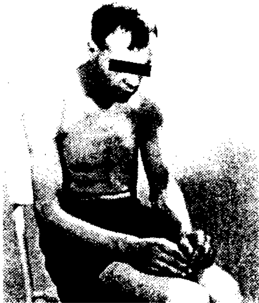
Mann unter Einfluß von Neuroleptika

Indem Psychiater immer wieder den leidenden und verängstigten Neuroleptika-Betroffenen für die Zeit nach der ‚Therapie‘ Hoffnung auf ein intaktes Sexualleben machen, zeigt sie den Weg zur Verhütung oder Vermeidung der psychopharmakologischen Schädigungen auf: Erst nach dem völligen Absetzen der Neuroleptika kann das Sexualleben wieder aufliegen, erst dann setzen Geschlechtstrieb, Orgasmus, Menstruation und Samenergüsse in ihrer normalen Weise wieder ein.