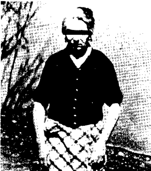
Frau unter Einfluß von Neuroleptika