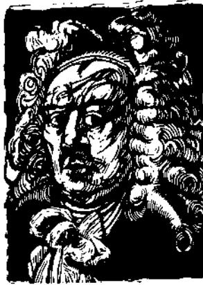
George Frederick Handel (1685-1759), known for his swings from depression to mania, composed his majestic Messiah oratorio in only six weeks. If he were living today, lithium would probably control his symptoms.

May we suggest that you see your Dome representative for the EMP (Empathic) COMMUNICATIONS program—a professional service designed to help your patients as well as their families and others in close contact with them.