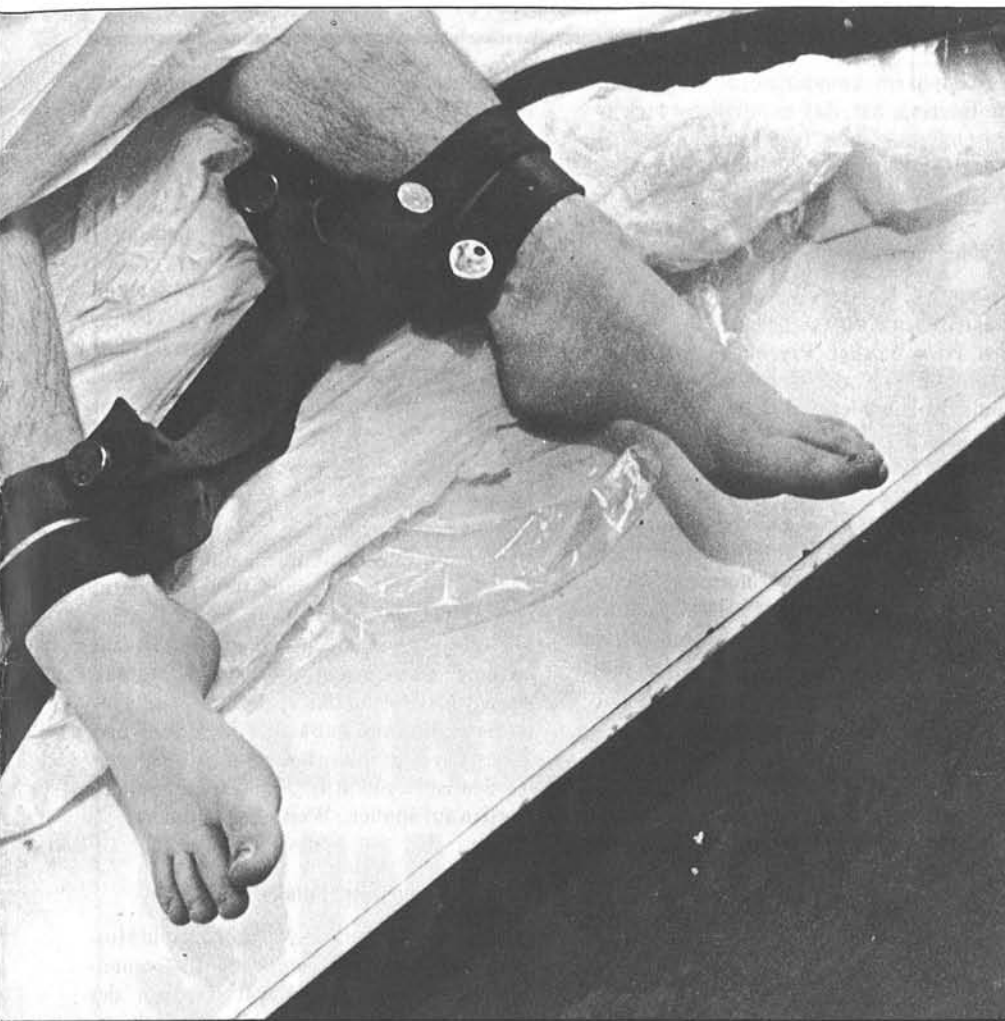
sche „Behandlung“ in einer Stockholmer Klinik anno 1977: daß es jemals eine Freiheitsberaubung im Namen der Psychiatrie gegeben hat.

Richterstuhl unser Platz wäre . . . Darum ist jedes psychiatrische Gutachten vor Gericht Machtausübung im Geiste des Gesellschaftschutzes und der Rassenhygiene, des einzig vernünftigen Sinnes all dessen, was man „Recht“ nennt.“