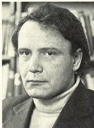
Wladimir Bukowski beschrieb die Praktiken sowjetischer Staatspsychiatrie. Gibt es im Westen nur graduelle Unterschiede?